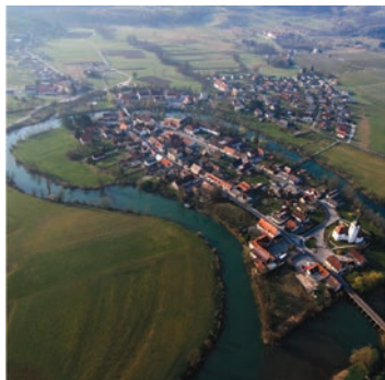
Kostanjevica na Krki