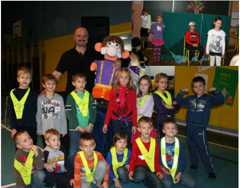
2012/2013 . Iskrivo in pisano na Olgici