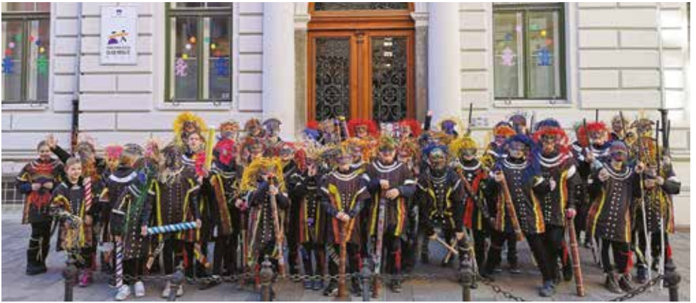
2018/2019 . Olgoridžini