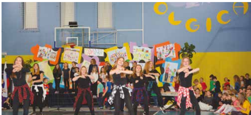
2016/2017 . Zdravi, zadovoljni, uspešni