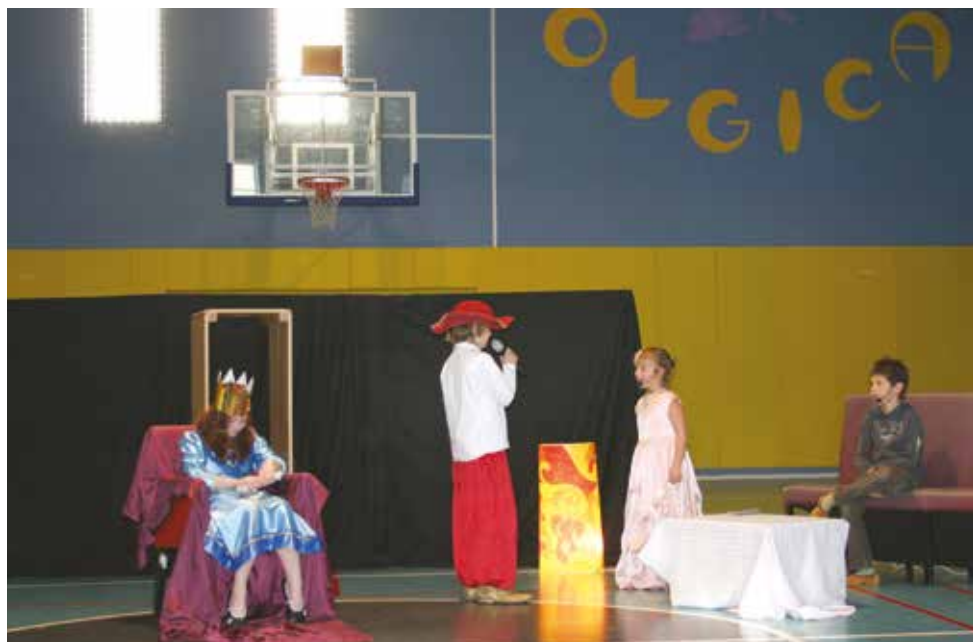
2010/2011 . Raznolike dejavnosti