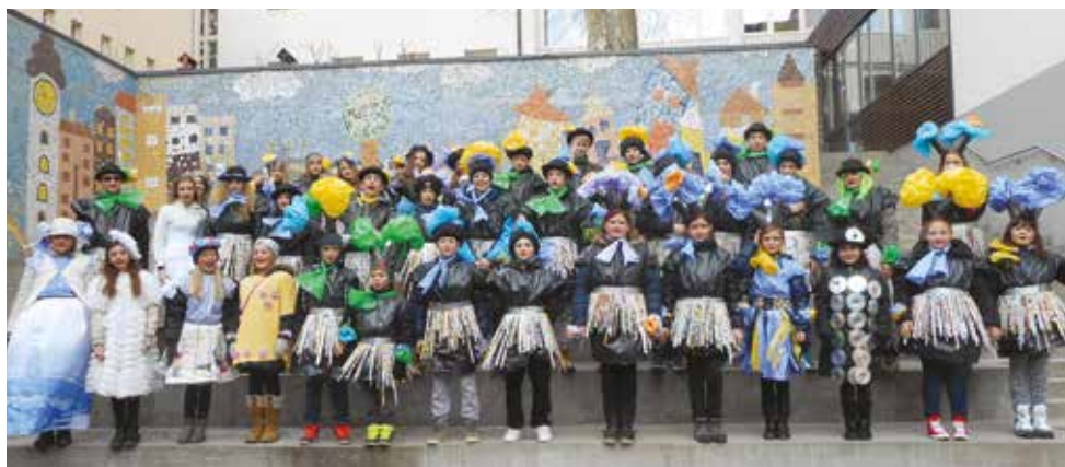
2015/2016 . Fantazijske rože