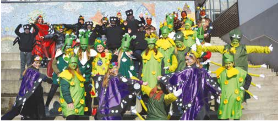
2017/2018 . Olgožužki