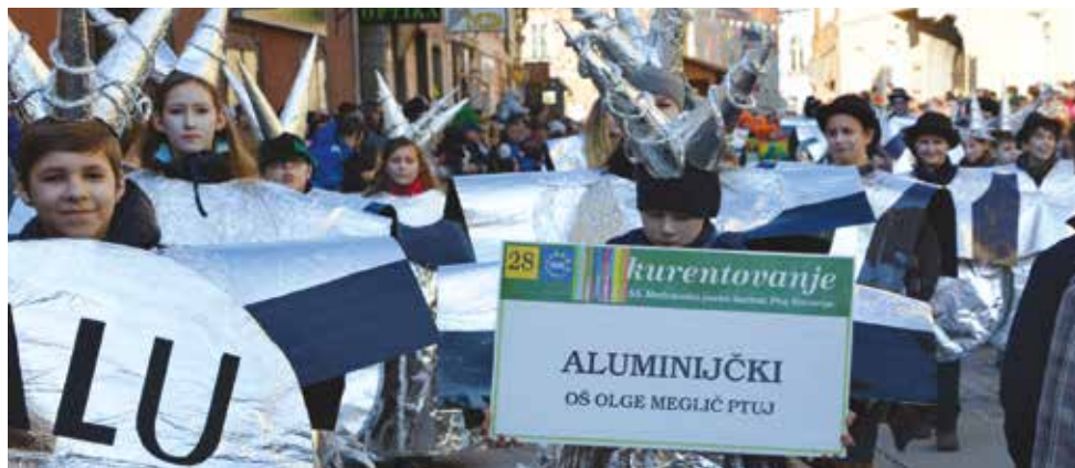
2014/2015 . Aluminijčki