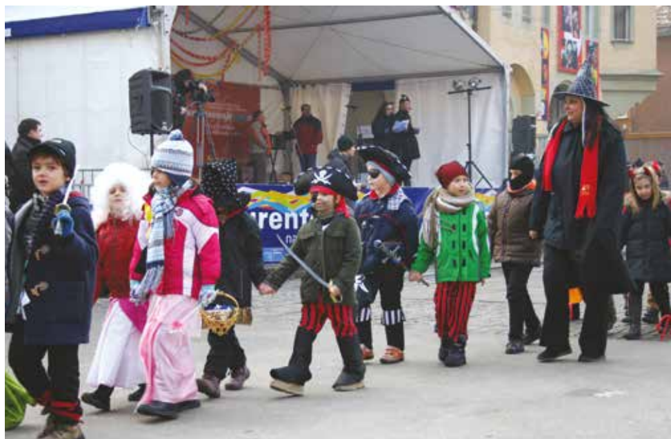
2010/2011 . Raznolike maske