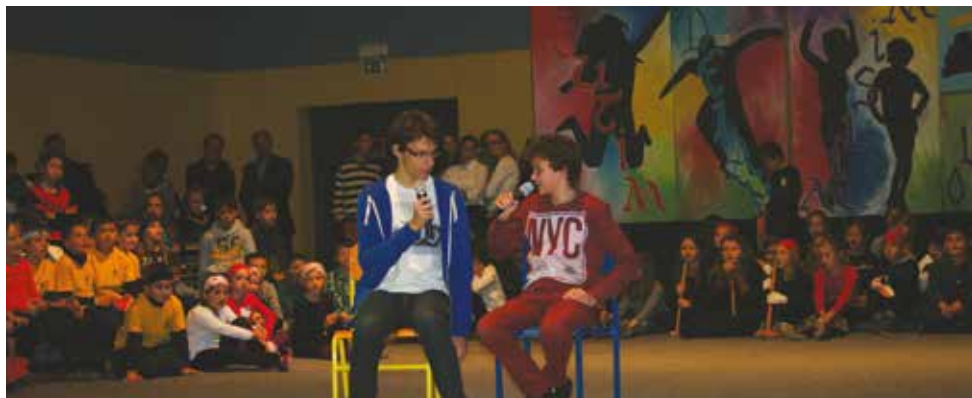
2014/2015 . Mislim, delam, čutim, torej sem in zmorem