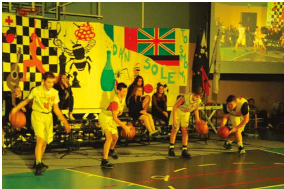
2018/2019 . Rekreativni, to smo mi