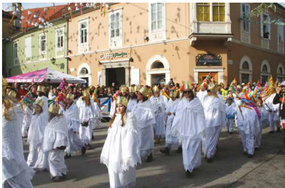
2011/2012 . Piccki in vile