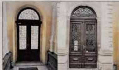
V okviru energetske sanacije so predvidena tudi restavratorska dela vhodnih vrat OŠ Olge Meglič.

V šolski delavnici je pri restavratorski učni uri študent in strokovnjakov na Lesarski šoli v Mariboru januarja p tokala predstavitev delovnega projekta Olgličina vrata učnost.