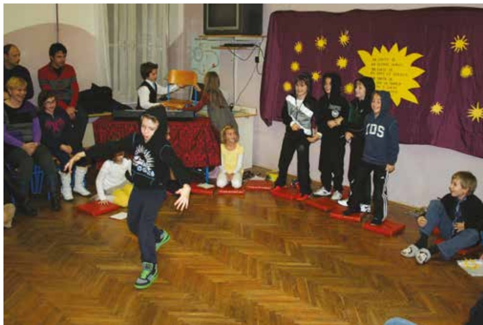
2011/2012 . Berimo za življenje