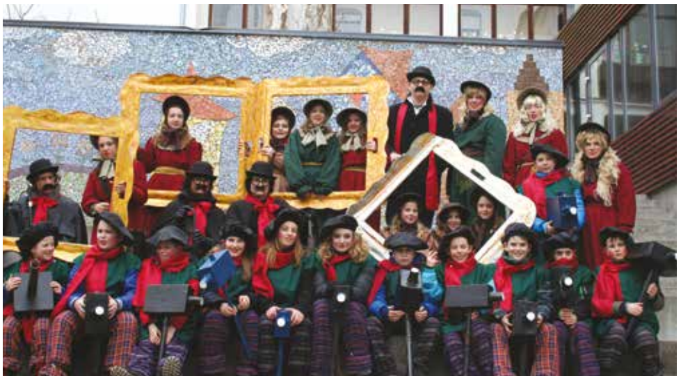
2013/2014 . Fotografi OŠ Olge Meglič