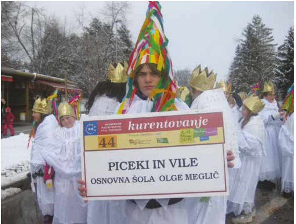
2012/2013 . Piceki in vile