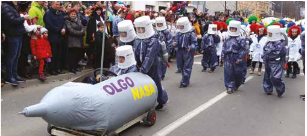
2019/2020 . Olgoplanet