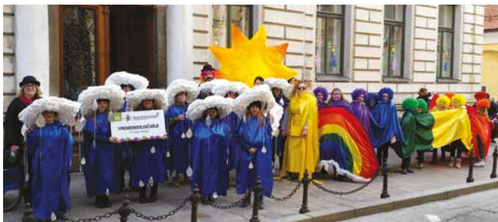
2016/2017 . Vremenoolgičarji