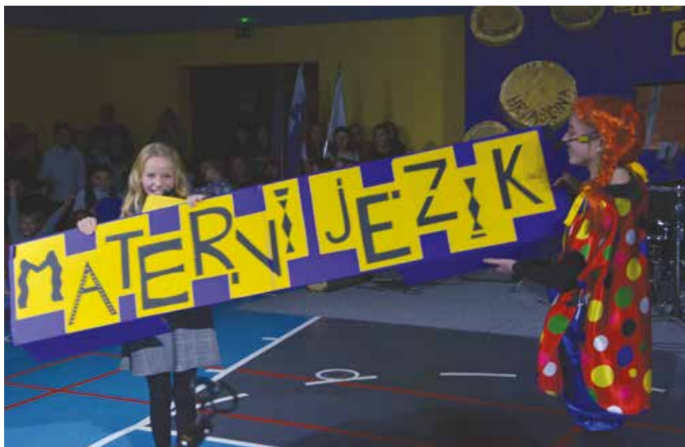
2017/2018 . Zaklad vsakega človeka – materni jezik